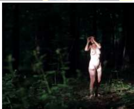
Photo issue du projet « Humeurs de modèles » publié sous forme de livre à commander via https://www.publier-un-livre.com/fr/le-livre-en-papier/2642-humeurs-de-modeles